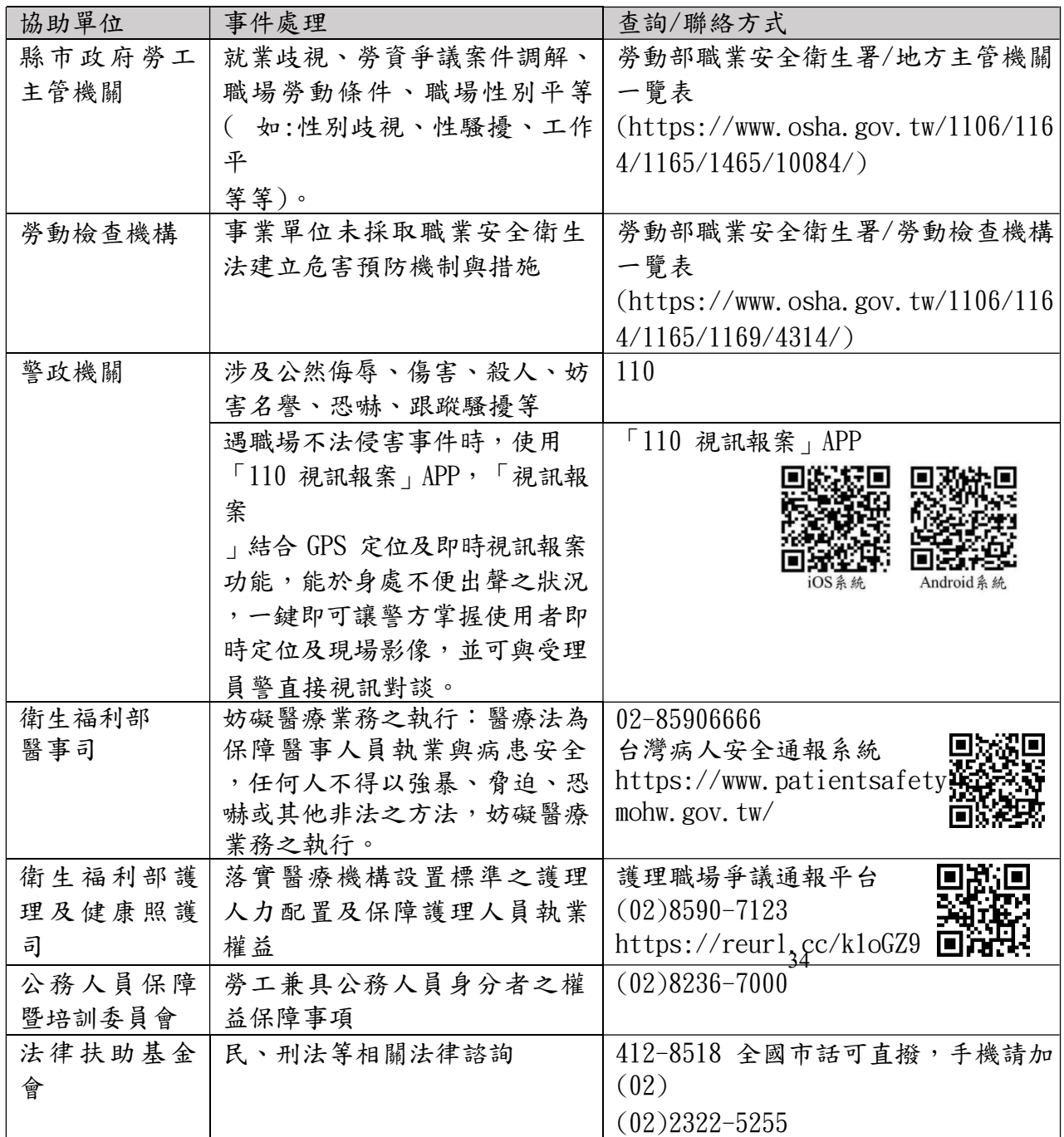
附表7 職場不法侵害事件處理相關協助資源